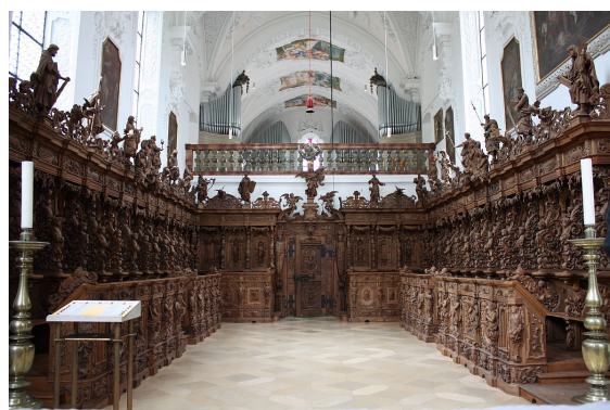
Stalles de l'abbaye de Buxheim

7- Observe le plan de l'abbé Martial Legros, et essaie de repérer les stalles. Sur le plan ci-dessous, entoure la partie de l'église où se déroulent les offices et où se trouvent donc les stalles.